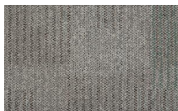
054 - Steel