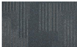
059 - Laguna