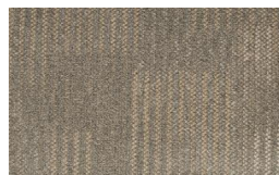
057 - Savana