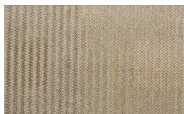
055 - Fancy