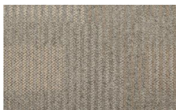
056 - Native