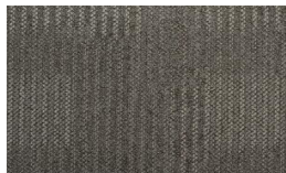
060 - Time