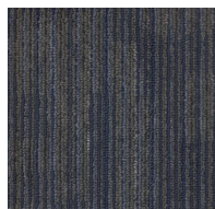
004 - Split