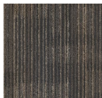
002 - Atom