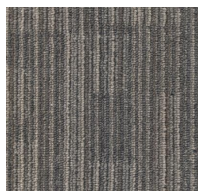
001 - Chip