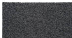
102 - Phantom