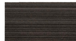
005 - Trento