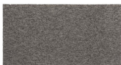
101 - Khaki