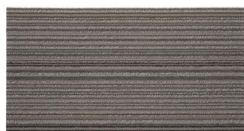
001 - Ravena