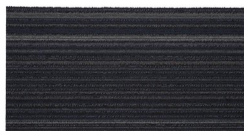
003 - Bréscia