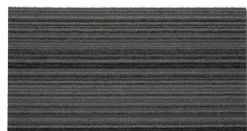
002 - Ferrara