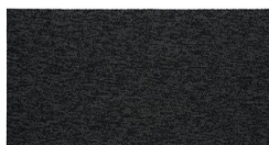
103 - Seal