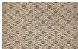
550 - Ambar