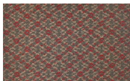
552 - Presidential