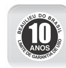
Selo de garantia de performance