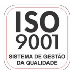
Empresa Certificada ISO 9001:2008