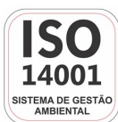
Empresa Certificada ISO 14001:2004